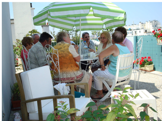
Tous à l'ombre... !!!

Nous nous sommes séparés vers 18 heures, bien décidés à recommencer l'an prochain !